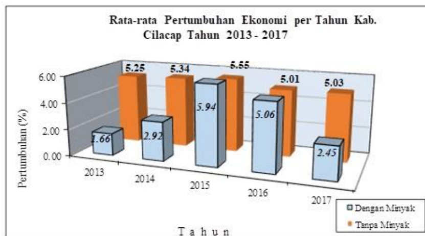
Gambar 1. Grafik pertumbuhan ekonomi